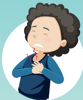
DOR DE CABEÇA OU NO CORPÔ