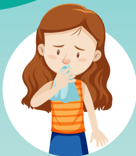
DOR DE GARGANTA